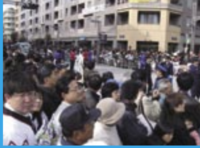
11:00前には出発地点の6番街交差点は人で埋まった。ベイタウン始めて以来の祭典の予感。