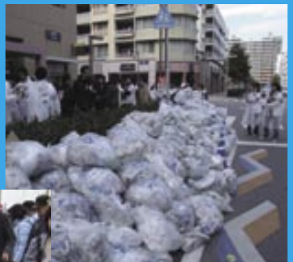
パレードが終わると、子どもも大人も紙吹雪を拾い、掃除を始めた。実行委員会では清掃ボランティアを組織していたが、突如起こった住民総出の大掃除でどんどん片づいていく。沿道のあちこちに紙吹雪の山ができていた。