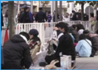
10:00、富士見通り沿いの歩道では場所取り完了。Mスタジアムの外野席が引っ越してきたようだ。