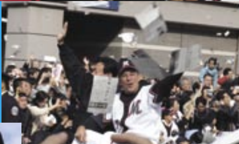
手を振るボビー・バレンタイン監督と選手たち。後日監督からはベイタウン・コミュニティに向け、感謝のメッセージが届いた(2面参照)。