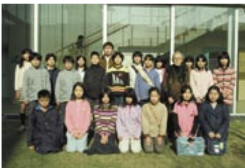
昨年12月に行われた撮影会。場所はベイトウン・コア中庭

ベイトウンニュース恒例の年男年女撮影会の参加者を募集します。来年の干支は戌（いぬ）です。戌年生まれの方が集まって写真を撮り、ベイトウンニュース新年号の表紙を飾ります。小学校5年生（12歳）から上は72歳、84歳、年齢は何歳でも結構ですが、資格があるのは戌年生まれの方だけ。戌年生まれであることとベイトウン住民であることが条件です。沢山の方の参加をお待ちします。撮影日当日、直接集合場所へおいでください。日時：2005年12月17日 午前10:00 集合場所：ベイトウン・コアアトリウム