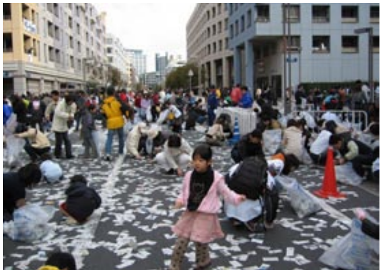
パレード車両の通過後、誰の指図も待たずに車道へ入ってゴミ拾いをはじめたベイタウン住民。子ども達の力が大きな戦力になった。

パレードと掃除が終わったあと、午後 1 時少し前、たぶん満員で入れないとは思いつつ千葉マリスタジアムで開かれている