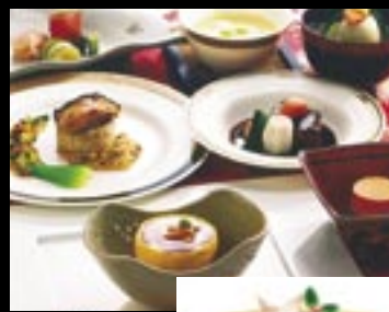
クリスマス会席 ディナー