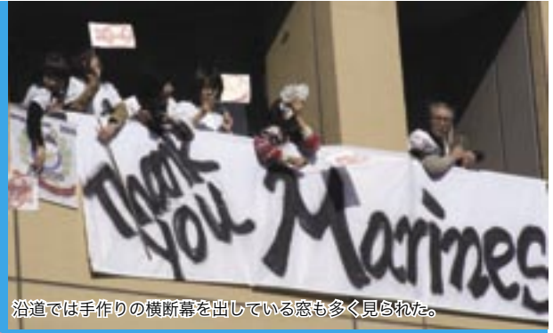
沿道では手作りの横断幕を出している窓も多く見られた。