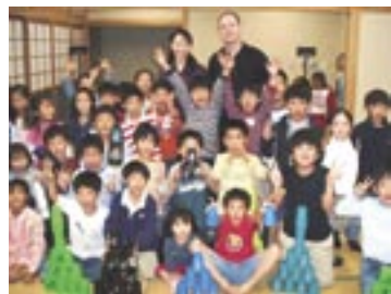
ベイトウンの教え子たちと

開催は、毎週金曜17時～18時（初級）、18時～19時（中級）、ミラリオ集会室にて。参加費無料。問合せは、TEL&FAX:043-213-0321/E-mail:info@speedstacks.jp/HP:www.speedstacks.jpまで。