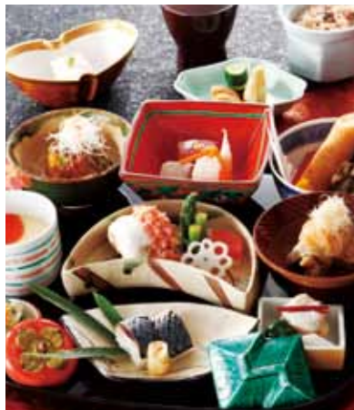
お祝い膳/イメージ

*料理・会場費・税金・サービス料込 ※大人5名様より承ります。※飲物は別途ご注文ください。 お問合せ 043-275-1146 (営業課 10:00~18:00) enkai@the-manhattan.co.jp