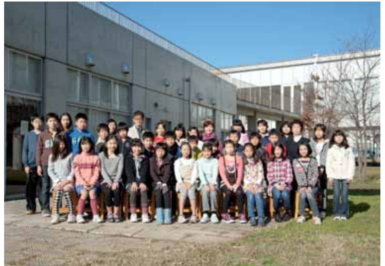
写真は今年の撮影会です。