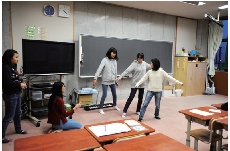
放課後に行われていた練習の様子。演出やセリフに工夫し、部員全員で意見を出し合って、試行錯誤しながら劇をつくり上げていきます。全員が舞台監督で俳優です。

通し練習が終わると、他校の先生の指導が入ります。ここではそれぞれの役についての掘り下げや、セリフの言い回し、脚本の意図などが話し合われました。指導を受ける姿は真剣そのもの。また指導