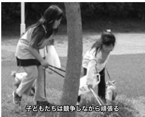
子どもたちは競争しながら頑張る

4月16日(土)9時半、集合場所の海浜公園の花時計の下にチワワ、プードル、テリア…様々な犬を連れて来た人たちが集まってきた。ゼッケンと軍手、炭ばさみ、ゴミ袋、活動の趣旨が書かれたパンフレットなどを受け取って、それぞれ海浜公園やベイタウンなど普段の散歩コースに散らばって、いざスタート。