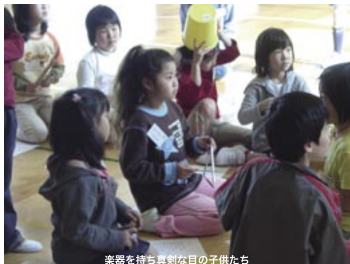
楽器を持ち真剣な目の子供たち