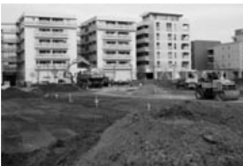
5/14のオープンに向けて工事中の公共駐車場

申し込み締め切り日：平成17年5月10日（火）。応募者多数の場合は抽選を行い、落選者にもご連絡します。